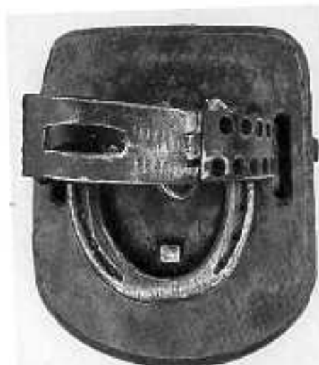
Traga (traga) av trä, en äldre modell. Hästskorna visar ungefär hur hästens fot var placerad. Traga av järn, nyare modell.

Strax före och i samband med omarronderingen av skogsmarken i Näs på 1960-talet byggdes ett mycket stort antal skogsbilvägar som gjorde det möjligt att avverka och frakta ut virke ur skogen året om. Tidigare var virkestransporter av nödvändiga förlagda till vintertid. Sommarvägarna som genomkorsade skogsområdena var inte farbara med häst och vagn. De var gångstiga och någon gång ridvägar och hade så varit sedan urminnes tid. Till några av fibodarna hade Bärsloge tillsammans med de privata skogsägarna byggt cykelvägar på 1930- 40-talen, t ex Håsta, Grånsberget, Nybua och Sälriset. För att skogsarbetarna lättare skulle ta sig till arbetsplatserna. Åke berättade att det sas att en av skogvaktarna byggde så smala cykelvägar att "bågsågen tog i", medan annan gjorde så breda att de kunde åka bil.