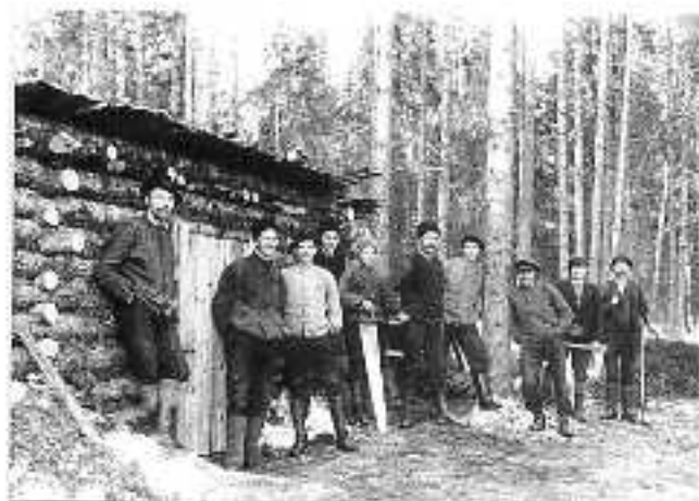
Skogsarbetarlag med kocka (?), men var?

Hemifrån byn och till fåbodarna togs det också som regel upp vägar på vintern. Ibland användes fåbodstugorna som vinterkvarter vid avverkningar och ofta hämtade man hem hö från fåbodar och myrblåssjor.