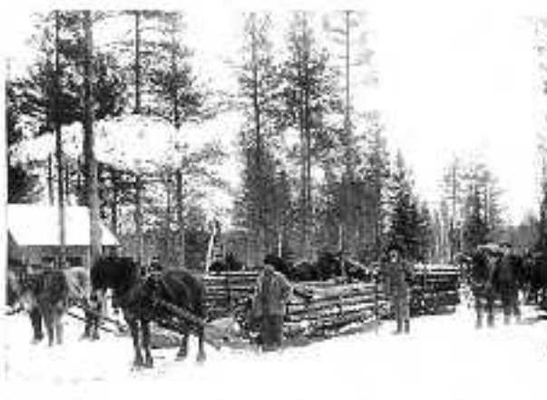
Hästar och körare vid Strandån

Samma vägsträckningar kunde brukas i många år eftersom avverkningarna var små med dagens mått mätt. Ett "lag" bestod av två huggare och en häst, och det var köraren som avlönade "sina" huggare. På en vinter kunde en ha avverkas av ett sådant lag, men det var många verksamma samtidigt i skogen. På Bergslagens bevakning fanns inte mindre än 118 hästar på 30-talet. Enbart vid Strandån – där en av flottlederna började – fanns det 36 hästar och runt 100 man samtidigt – ett Klondyke i timmerskogen! Där fanns stall för alla hästarna och övernattningsbaracker för körare och huggare.