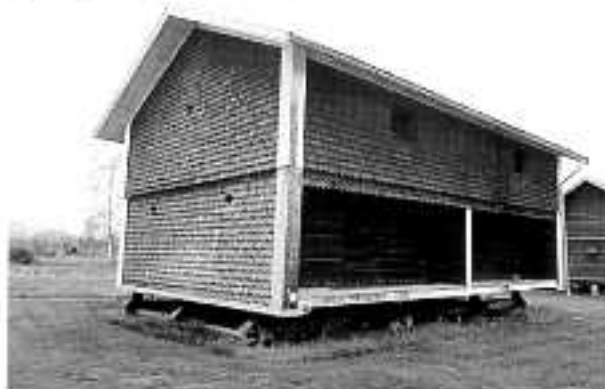
Nås sockenmagasin

Källor: Karl-Erik Forslund, Med Dalälven från källorna till havet . Del 2, bok 7, Nås.