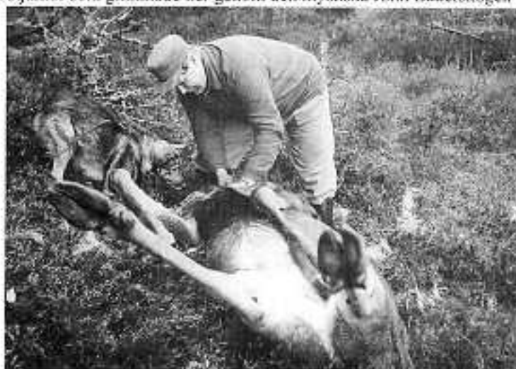
Älgjakt i Sälriset