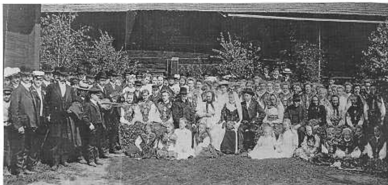
Bröllop 1907. Många av bröllopsgästerna är identifierade – fråga Pej om du vill veta vilka som är med.