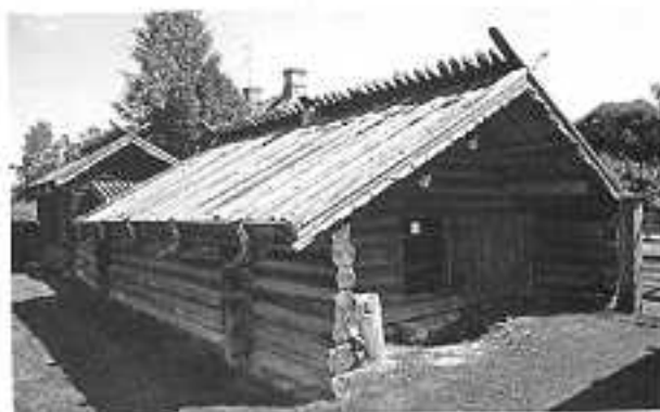
Loråskasernen (ovan), Zorn museet, Mora (nedan).