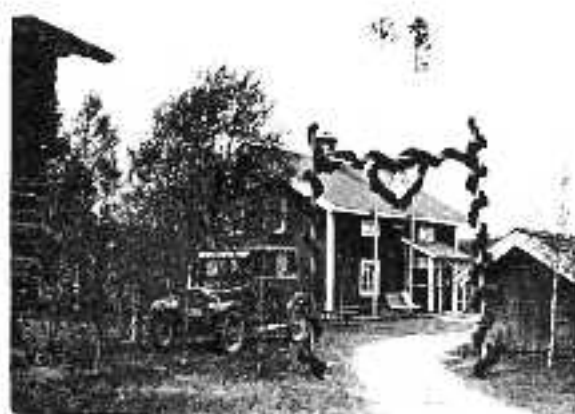
Exempel på Resta Kryckor fast bredvid ingången.