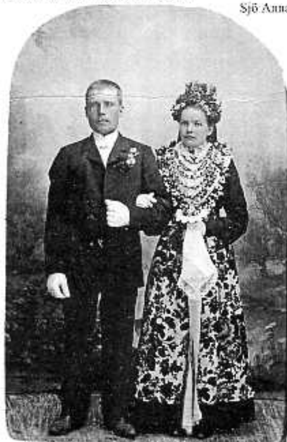
Så kunde ett Näs brudpar se ut på den tiden. Beskåda halsprydnaden på bruden. / Sjö Anna