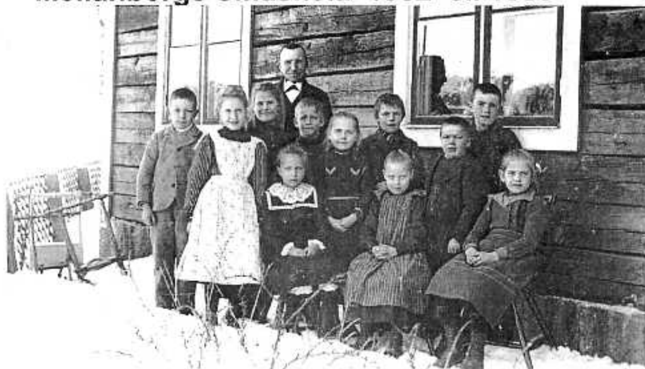
Klassfoto vid sekelskiftet utanför norra väggen vid Mellanborgs skola