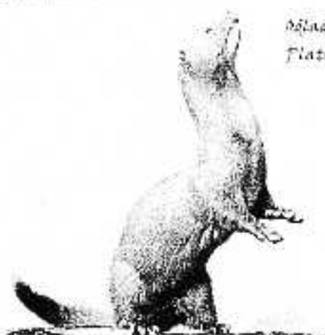
Platina mink s.k. Platinamink