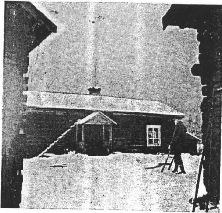
En gård i Hedens by, Nås

lorna för dagen och att bearbeta mjölken till smör, ost av alla slag och annat på de dagar, då man var fri från vallgången.