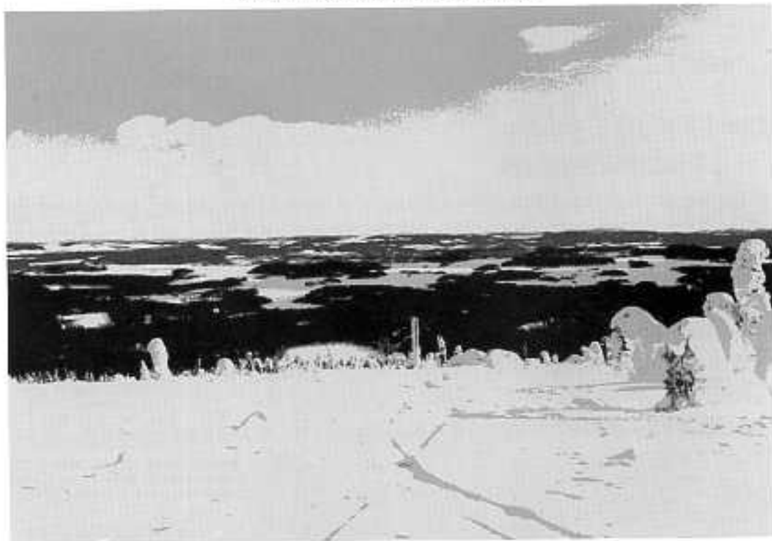
Vinterbild med utsikt över sjön Närsen

Vi bygger bo vid stranden, där växer förgät-mig-er, där kan vi se soluppgångsbranden, och just där vill jag sitta med Dej. Vi skall leva vi två för varandra! Alltid sommarsol vid vårt tjäll! O lilla Du, Snart himmelsens stjärnor skall tindra var vinterkall kväll.