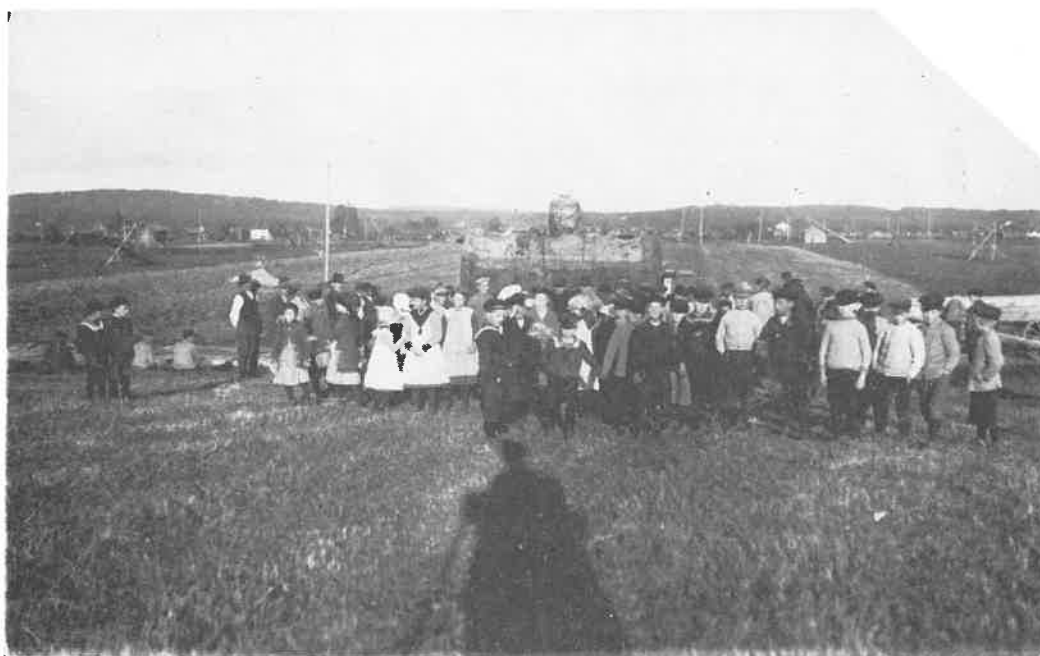
Ångpannan till Hedens såg fraktas över åkern c 1917

Jag hoppas, låt oss hoppas, att inte främlingshatet får grogrund i Nås. Att inte tron på rasen människa som vettig, rationell, human, god alldeles raseras.