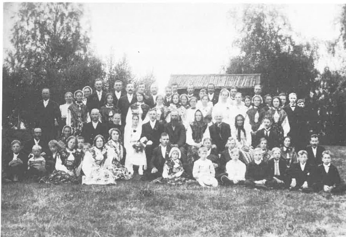
Bröllop 1917 på Lisskvarngården (nu vår hembygdsgård).