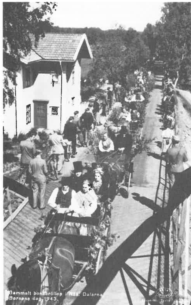
Gammalt bondeböjlopp i Nås, Dalarna. Barnens dag 1943.

För alla dem, som är intresserade av bygden och dess historia vill vi gärna rekommendera besök på Nås bibliotek. Detta har blivit något av ett kulturellt centrum, där besökare och bibliotekarie diskuterar, utbyter information och där man förutom bibliotekets böcker, talböcker, tidskrifter o.d. kan ta del av en fin samlingen av kartor, gamla fotografier och artiklar som har anknytning till bygden.